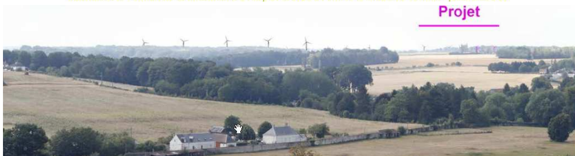
Illustration 15 : vue à 25° extraite et agrandie de la simulation précédente et cadrée vers projet éolien de Levroux (et ceux de Champs de Baudres et de la Juchepie)