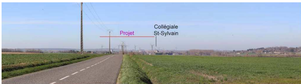
Illustration 32 : extrait de la simulation n°30 depuis la D926 à l'est de Levroux - panorama à 40°

Jean-Pierre Chêne: il n'y a pas déjà eu ce projet-là dans les années précédentes ?