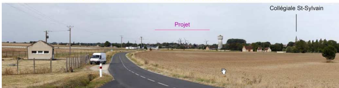
Illustration 27 : extrait de la simulation n°21 depuis la D926 à l'entrée orientale de Levroux - panorama à 60°