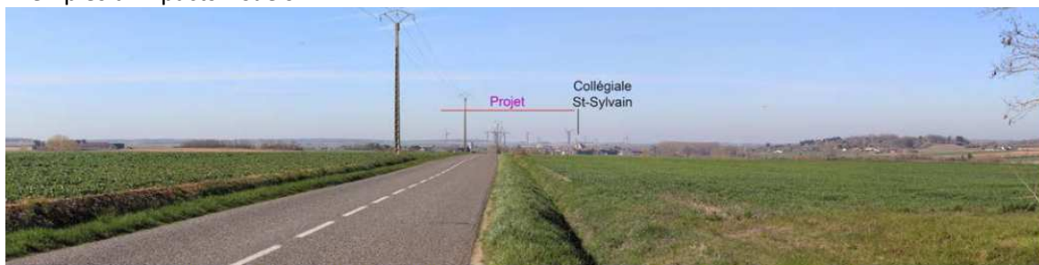
Illustration 26 : extrait de la simulation n°30 depuis la D926 à l'est de Levroux - panorama à 60°