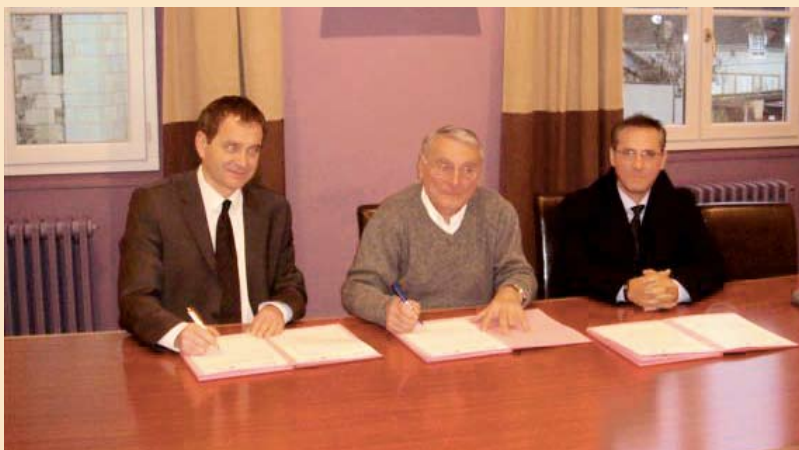
Signature de la convention avec ERDF, la FMRJC et Monsieur le Maire pour l'exposition scientifique «des maths... en somme ! »